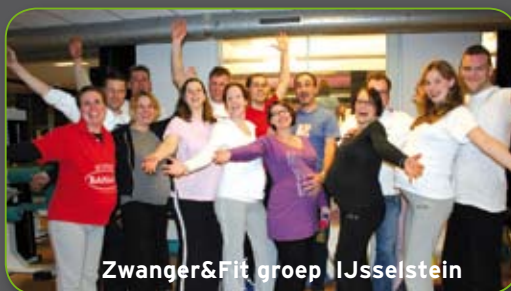
Zwanger&Fit groep IJsselstein

Kijk voor meer info over onze organisatie op onze website: www.fysiophysics.nl